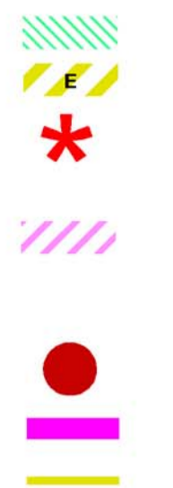
TAVOLA B: Indirizzi di governo del territorio